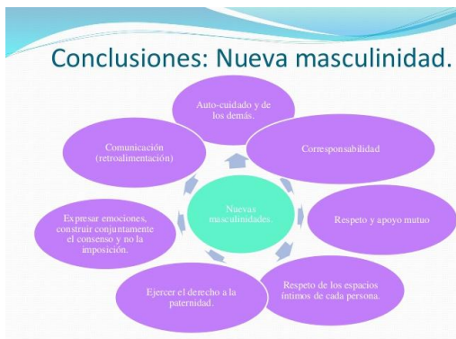
Imaxe: Pablo Duque Melguizo; "Diagnóstico de los factores y dimensiones

estructurales que inciden en la violencia de género"